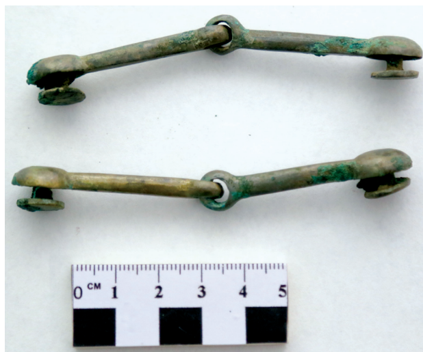
Рисунок 6. Бронзовые шарниры-стабилизаторы в виде двухзвенчатых удил для подвешивания кинжала и горита (колчана) к поясу Figure 6. Bronze hinges-stabilizers in the form of two-rung munch for suspension of the dagger and the gorite (quiver) to the belt

Описание лицевого скелета. Лицевая часть черепа не широкая и относительно высокая, по верхнелицевому указателю – мезенная (верхний отдел лица средний). Углы горизонтальной профилировки относятся к категории очень больших и средних, т.е. лицо значительно горизонтально