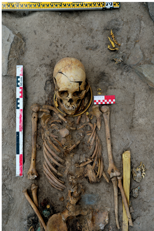
Рисунок 5. Бронзовый кинжал и золотые ножи Figure 5. Bronze dagger and gold sheath

Лоб несколько скошенный и визуально достаточно широкий. Абсолютные размеры наименьшей и наибольшей ширины лба входят в категории средних и больших. По лобно-поперечному указателю череп мезоземный (лоб средней ширины). По близкому к средней величине указателю кривизны лобной кости можно сделать вывод о не сильном ее изгибе. Развитие надпереносья оценивается в три балла по шестибалльной шкале Брока [Алексеев, Дебец 1964]. Надбровные дуги (тип II) заходят на середину верхнеорбитного края, но не заходят за скуловой отросток.