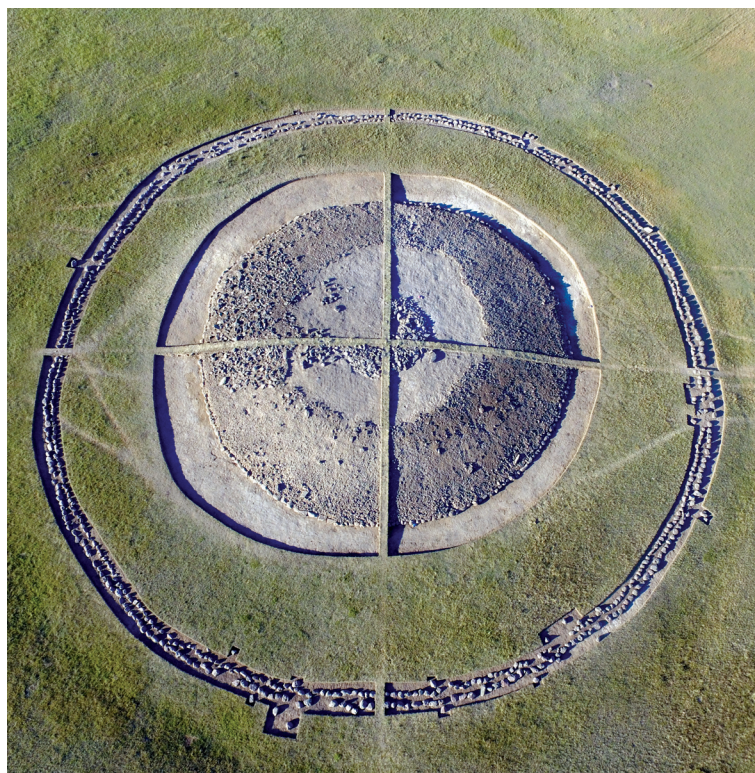
Рисунок 1. Двухрядное внешнее кольцо кургана 4 Figure 1. Two-row outer rings of barrow № 4