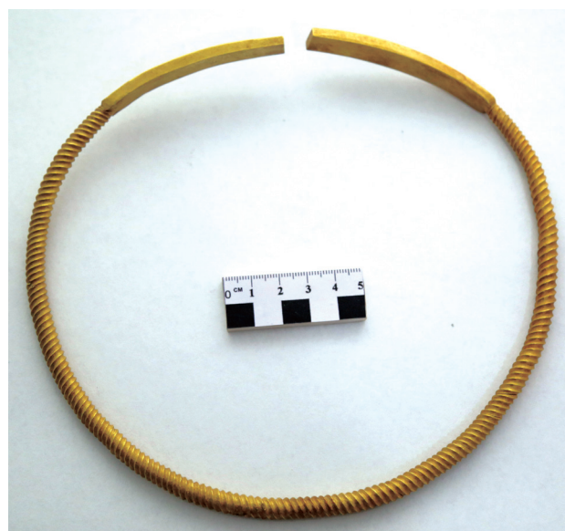
Рисунок 4. Золотая гривна из перекрученного стержня Figure 4. Golden neck ring from twisted rod

Результаты краниометрического исследования представлены в таблице 1. Абсолютные размеры не позволяют судить о форме и пропорциях черепа. Такое представление можно получить при анализе относительных размеров или индексов (табл. 2).