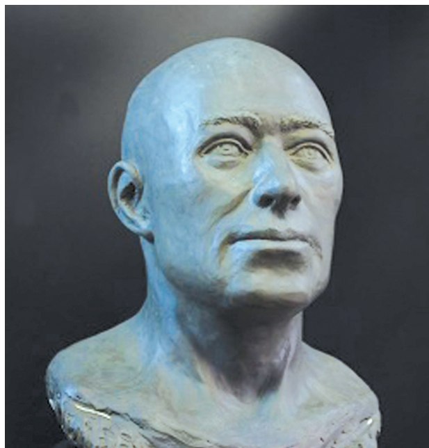
Рисунок 9. Скульптурная реконструкция по черепу юноши из погребения 2 кургана 4 Елеке сазы. Автор Веселовская Е.В.

Figure 8. Graphic craniofacial reconstruction of a young man from the burial of 2 barrow 4 Eleke sazy. Author Veselovskaya E.V.