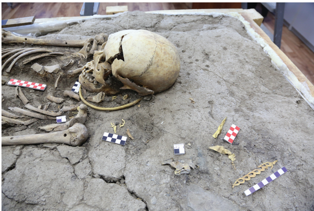
Рисунок 3. Золотые украшения возле головы погребенного Figure 3. Gold ornaments near the head of the buried

левой стороны зафиксированы перевернутые фигуры одного оленя в лежащей (или летящей) позе с роскошными рогами и вставками из цветных камней и нескольких безрогих маралов, которые украшали, скорее всего, край налучья. На фалангах обеих ног погребенного находилось большое количество трубчатого бисера диаметром 1 мм из золота, аналогично памятнику Аржан 2 в Тыве [Чугунов с соавт., 2017, с. 416, табл. 78: 1,2].