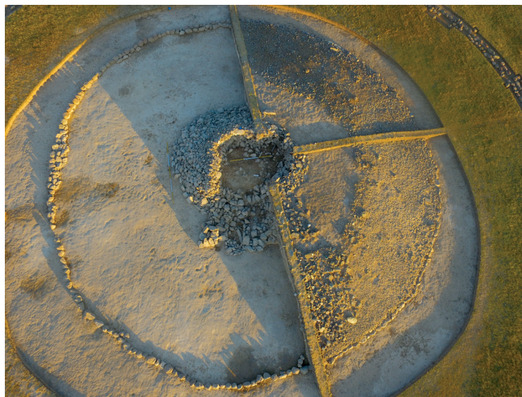
Рисунок 2. Погребальная камера кургана 4 Figure 2. Burial chamber of barrow № 4

миды), как базовый элемент всей структуры сооружения, строилась, согласно нормам ритуала, на уровне древнего горизонта. Внутри погребальной камеры сначала, видимо, возводили бревенчатый каркас, наподобие байгетобинского в Шиликтах [Толеубаев, 2013, с. 125], но с некоторыми иными техническими приемами, поскольку здесь,